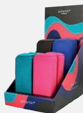
EXPOSITORES PRÉSENTOIRS EXPOSITORES