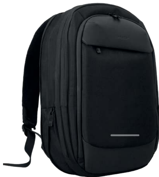
Expandible | Extensible | Expansível 450 x 290 x 120 mm