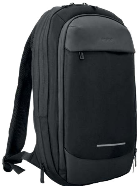
Ultradelgado | Ultrafin | Ultra fino 450 x 290 x 45 mm