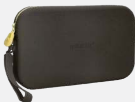
PORTATODO TROUSSE ESTOJO